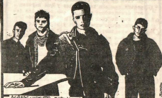
AGRADECIMIENTO ESPECIAL A FEDERICO DEL PALACIO DE LA MÚSICA (SUC. GAUCHO)

Lado B: 1) Si tan solo estuvieses (Schellenberg - Berhau). La introducción es con teclados, luego aparece la guitarra y después la batería, que le da un ritmo medio. No desentona con los anteriores. Termina con un redoblante y los teclados de fondo. 2) Todo igual (Schellenberg). A esta altura, uno de los clásicos de ADN. Muy buen tema. Integró la ensalada "Rock 4" hace muy poco. El teclado funciona como base y en ocasiones pasa a un primer plano haciendo una especie de punteo que identifica fácilmente el tema. 3) Las marcas del halcón (Schellenberg). También ya registrado pero en vivo para "Rock en el Palacio". Esta versión de estudio mantiene su nivel. El teclado es importante, muy buen trabajo. 4) La piedra (Berhau). Este surco va